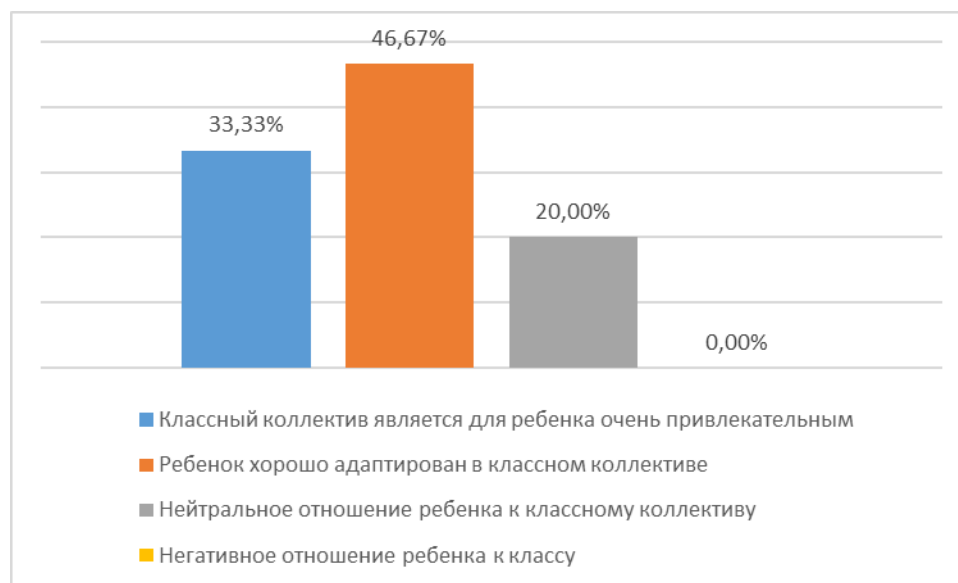
Диаграмма 3. Уровень привлекательности классного коллектива для учащихся.

Исходя из данных диаграммы 3, можно увидеть, что в 5 классе у большинства детей преобладает высокий уровень комфортности и привлекательности классного коллектива. Это значит, что атмосфера внутри класса полностью удовлетворяет детей. Это свидетельствует о том, что атмосфера взаимоотношений в классе для большинства детей комфортная и благоприятная.