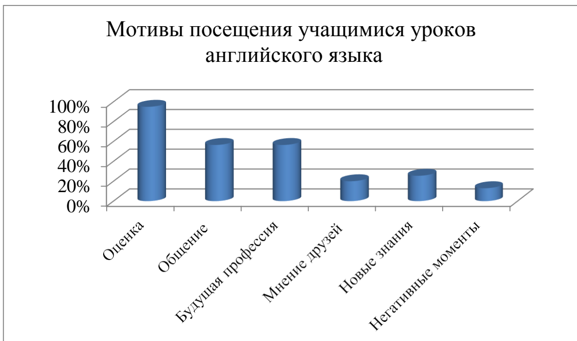
Диаграмма 2. Мотивы посещения учащимися уроков английского языка.

При ответе на четвёртый вопрос, мнения учителей разделились следующим образом 57,5% учителей считает, что укрепления интереса к английском языку необходимо использовать различные ТСО (учебные фильмы презентации, обучающие программы, Интернет), 43% уверены, что периодическое обновление содержания приводит к повышению интереса к изучению английского языка, и 58,5 % учителей отметили, что для достижения вышеозначенной цели требуется реорганизация процесса обучения, т е применение новых технологий обучения (диаграмма 3).