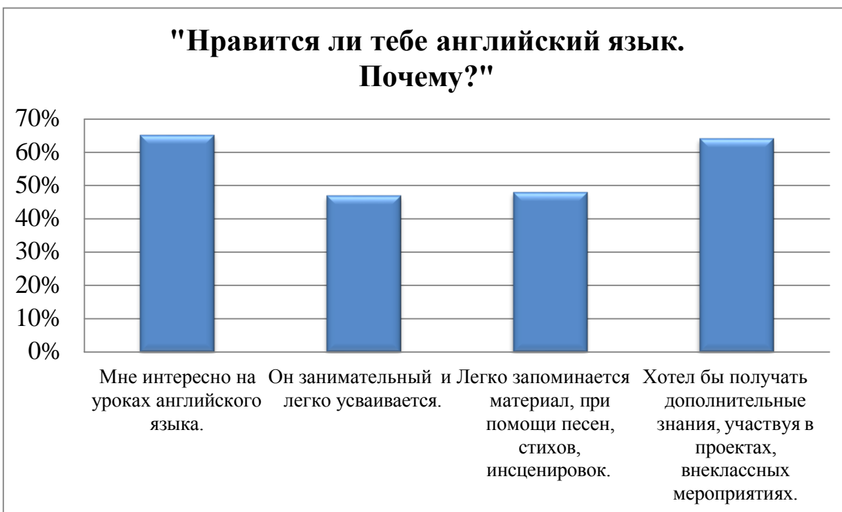
Диаграмма 4. «Нравится ли тебе английский».

Далее учащимся была предложена анкета «Английский язык в школьном расписании», где нужно отметить желаемое количество уроков в неделю. Статистика соотношения ответов учащихся на вопрос данной анкеты отражается в диаграмме 5.